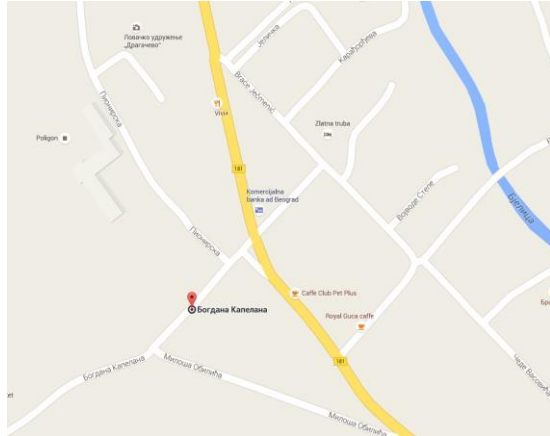
Мапа локације Одељења у Гучи