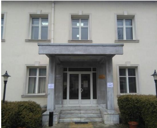
Зграда одељења у Гучи