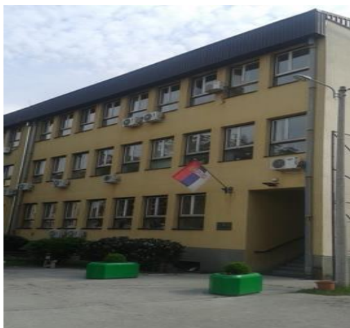
Зграда седишта Прекршајног суда у Чачку