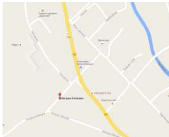
Mapa lokacije Odeljenja u Guči