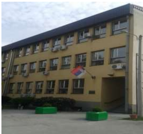
Zgrada sedišta Prekršajnog suda u Čačku