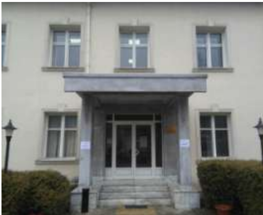
Zgrada odeljenja u Guči