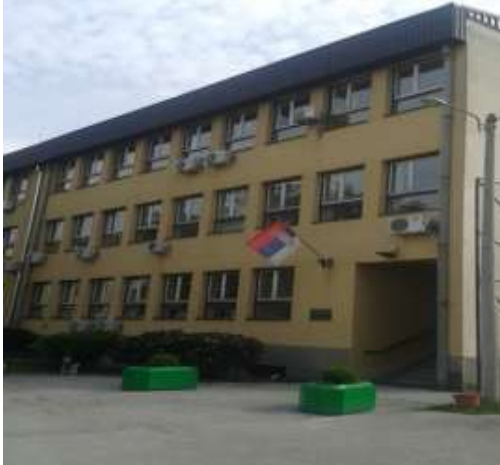
Zgrada sedišta Prekršajnog suda u Čačku