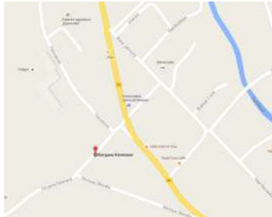
Mapa lokacije Odeljenja u Guči