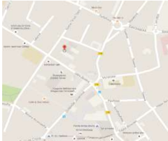
Mapa lokacije sedišta Prekršajnog suda u Čačku