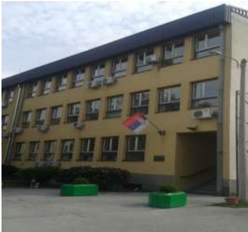
Зграда седишта Прекршајног суда у Чачку